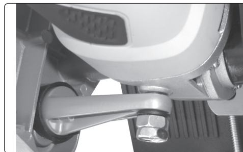
3. ábra / Abb. 3 / Fig. 3