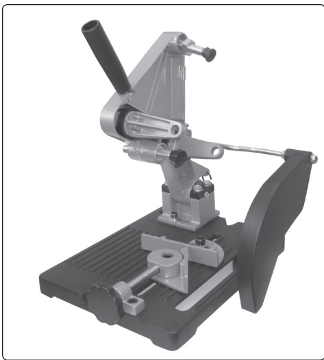
1. ábra / Abb. 1 / Fig. 1